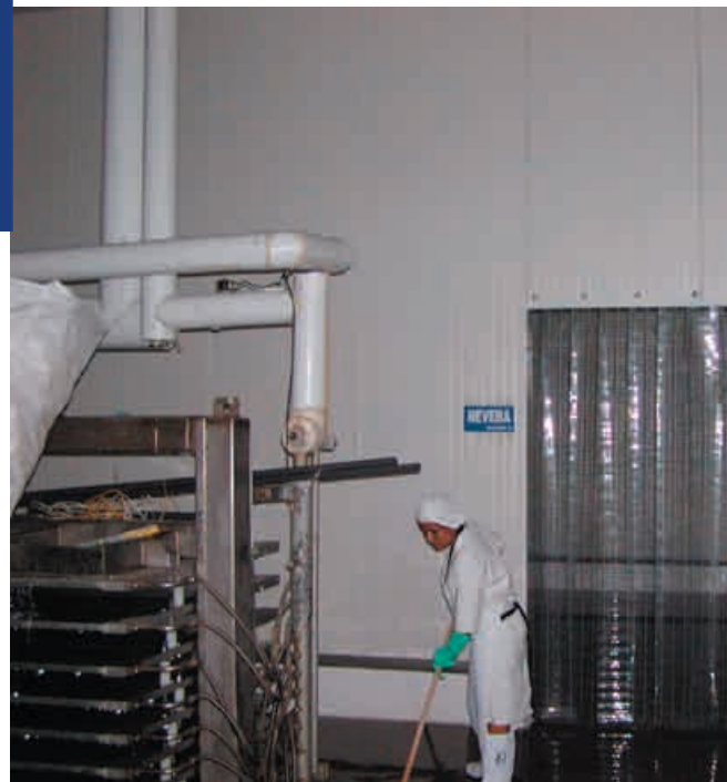
Cumple con la norma: NOM-008-ZOO-1994